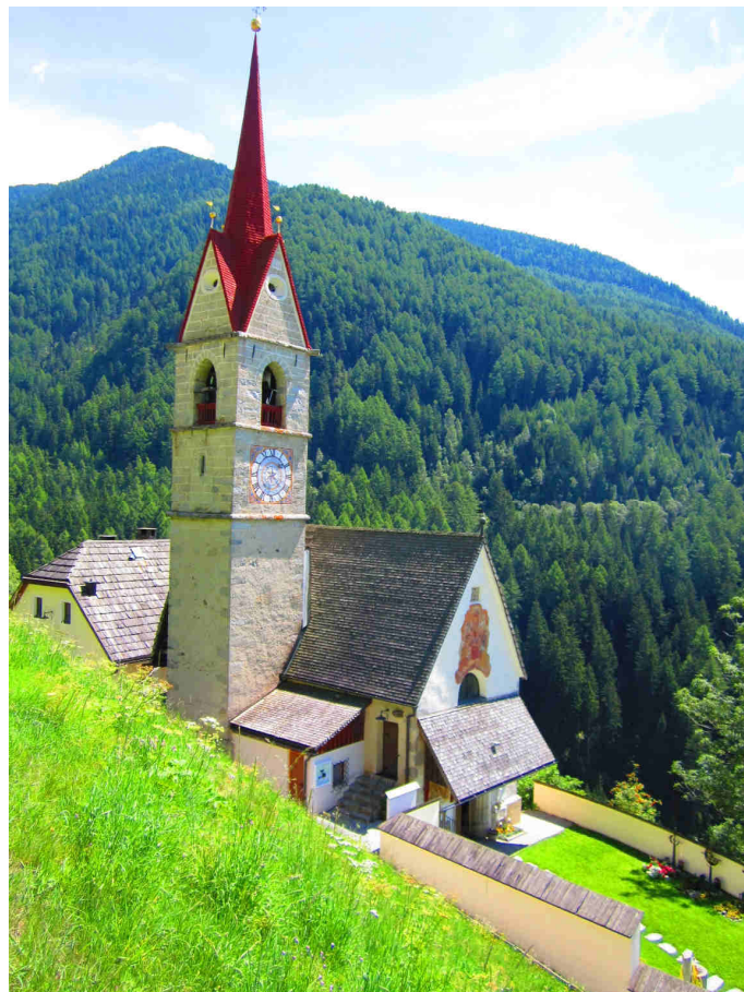
Figura 2: la chiesa di Rio Molino.