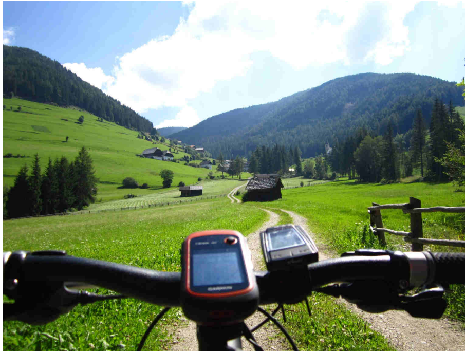
Figura 1: Montassilone.