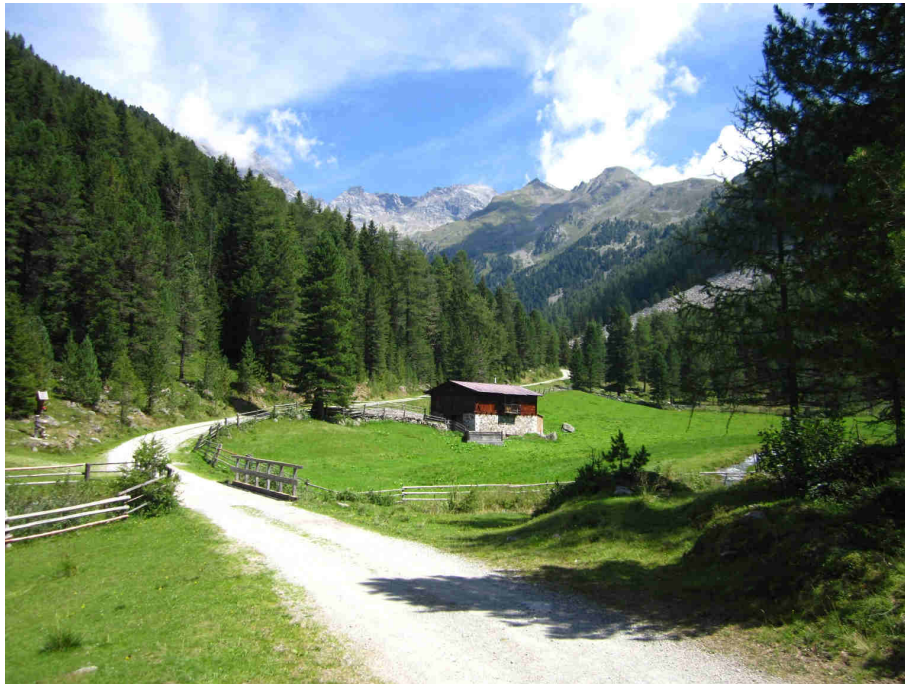
Figura 5: verso la Huber Alm.