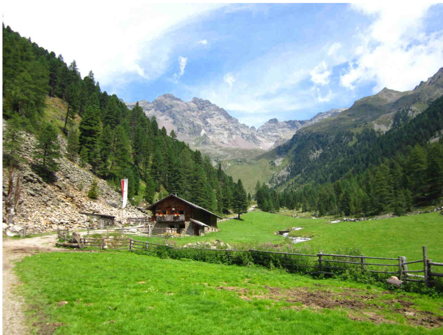
Figura 6: la Huber alm.