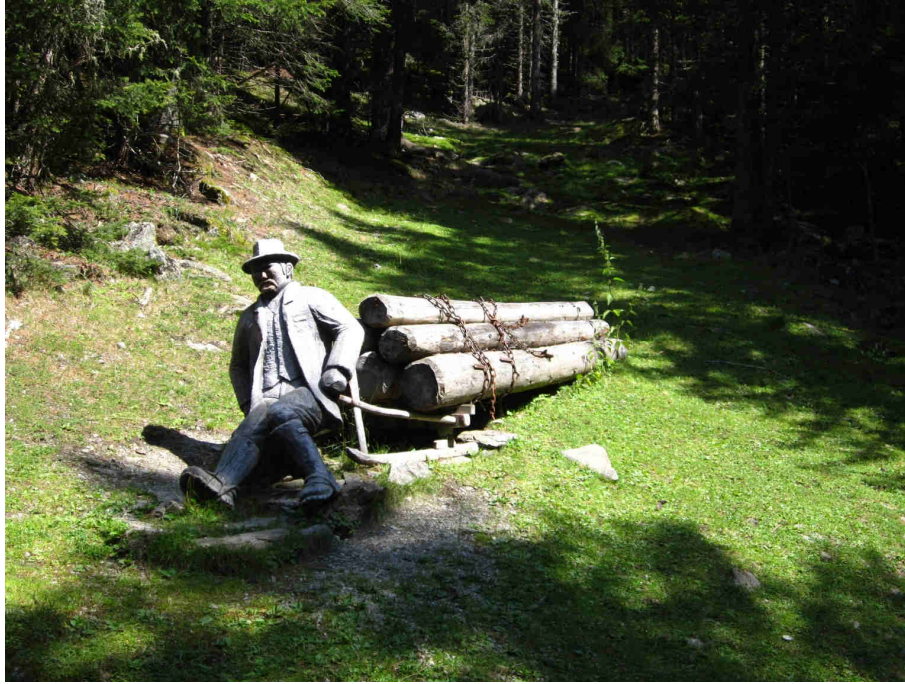
Figura 3: sculture lungo la strada che porta ai Bagni di Rio Molino.